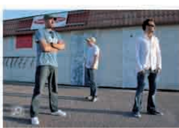
Die Kieler Hip-Hopper „Büro am Strand“

Gürtel: Wir haben uns bei der Bandgründung im Jahr 2000 überlegt, dass wir einen Namen finden müssen, der unsere Texte widerspiegelt. Büro steht für das etwas Seriösere, das wir – man glaubt es kaum – auch hin und wieder in den Texten haben und Strand steht für das Lebensgefühl und die gute Laune, die wir verbreiten wollen.